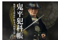
『鬼平犯科帳』